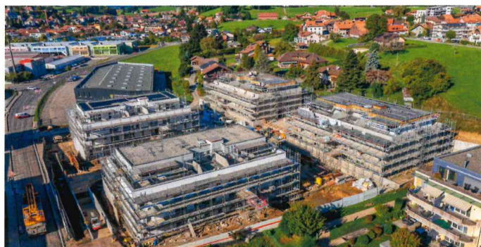
Construction de 102 appartements avec parking souterrain – PPE La Fontaine à Châtel-St-Denis. Années de construction: 2020 - 2022.

Pour vous, nous réalisons la construction de villas, chalets, appartements ou immeubles de vos rêves. Afin de vous accompagner dans cette création unique, nous choisissons de collaborer avec des entreprises locales. De plus, nous attachons une importance particulière à la manière dont sont construits nos biens. En effet, la plupart de nos affaires possèdent le Label Minergie.