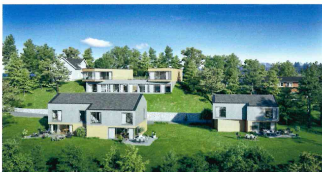
Construction de 2 villas jumelles et 1 individuelle - Le Manège à St-Légier – Perspectives. Années de construction: 2020 - 2022.